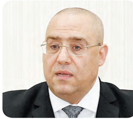
✎ عاصم الجزار

وأشار الوزير، إلى الانتهاء من الهيكل الخرساني لـ15 برجاً سكنياً بارتفاعات تصل إلى 44 دوراً، وجار