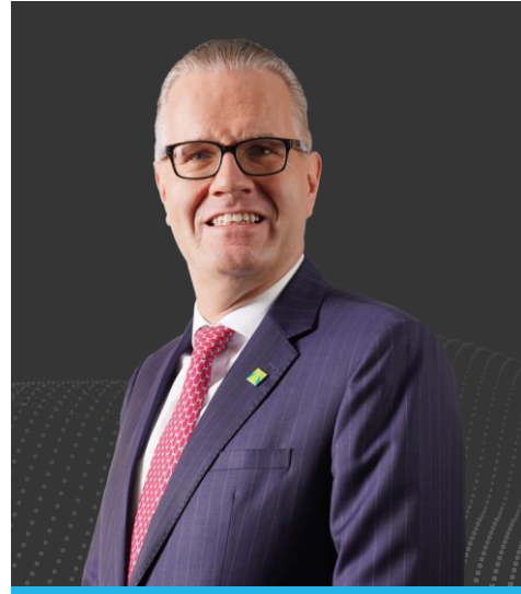
الدكتور بيرند فان ليندر الرئيس التنفيذي