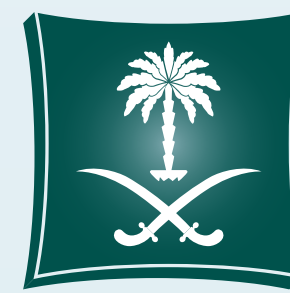
وزارة التجارة Ministry of Commerce