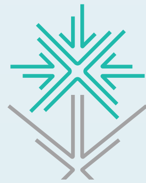
وزارة الاقتصاد والتخطيط MINISTRY OF ECONOMY & PLANNING