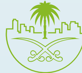
وزارة البلديات والإسكان Ministry of Municipalities and Housing